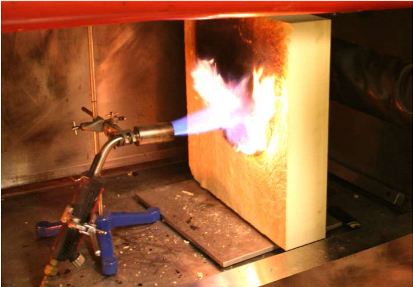
Brandtest op PIR-isolatie.