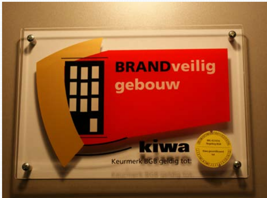
Het Keurmerk Brandveilig Gebouw is het sluitstuk van een uitvoerige inspectie op 146 aandachtspunten