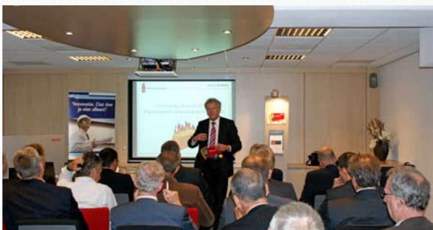
Expertisegroep Integrale Brandveiligheid deelt kennis tussen architecten, bouwers en gebouwbeheerders.

Dikwijls komen er vlak voor een oplevering van het gebouw gebreken aan het licht qua brandveiligheid. Bijvoorbeeld een wand-doorvoer of een aansluiting tussen wand en dak die niet voldoende brandwerend zijn uitgevoerd. Details die van doorslaggevende betekenis zijn voor het gedrag van een brand in een gebouw. Deze fouten zijn regelmatig terug te voeren door een gebrek aan communicatie over brandveiligheid tussen de partijen in de bouwketen. Het Centrum voor Innovatie van de Bouwketen (CIB) heeft de handschoenen opgepakt en roept ontwerpende en uitvoerende partijen op zitting te nemen in de expertisegroep integrale brandveiligheid.