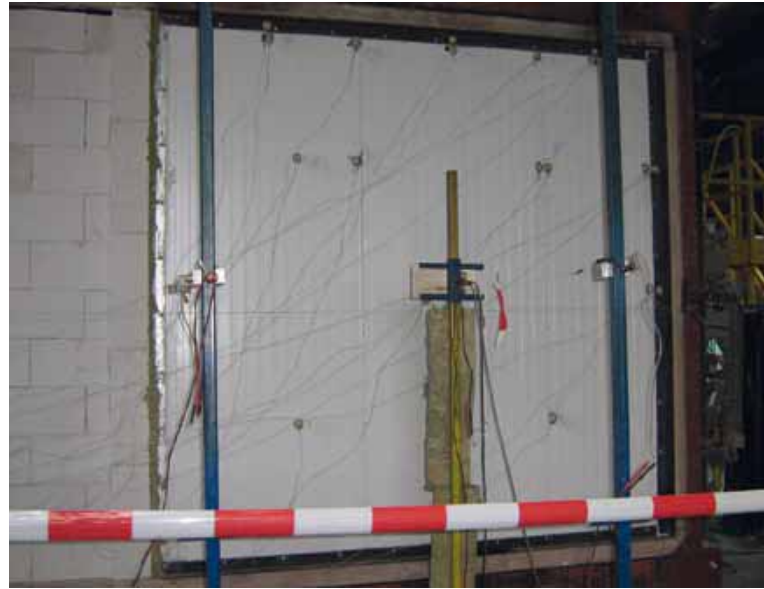
Testopstelling bij Efectis in Nederland waarbij het KS1000CS paneel van 175 mm een brandweerstand van 60 minuten behaalde.

“Voor wat betreft het nemen van extra maatregelen om branduitbreiding te voorkomen, maakt het niet uit of er steenwolisolatie dan wel PIR-isolatie op het dak wordt toegepast.”