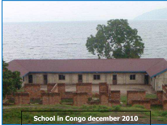
School in Congo december 2010

Begin januari 2010 is IKN begonnen met het werven van fondsen om de school in Congo te kunnen financieren. Door de verslechterende economie van het land is besloten de school gefaseerd te bouwen.